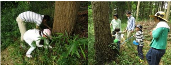
例年と違ってトンボの姿が全く見られず、チョウもとても少なかった。しかし虫好きの親子は、カブトムシ・ナナフシ・バッタ・カミキリムシなどたくさん探しました。