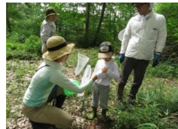
最初に森の紹介・注意事項・虫の取り方の説明 体操で体をほぐして、いよいよ虫探しへ