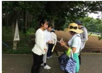
3名の中高校生ボランティアとともに森の入口で受付